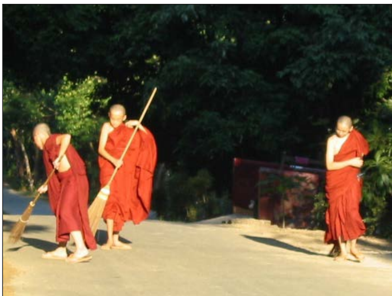
▲ 弟子有服务师长的义务