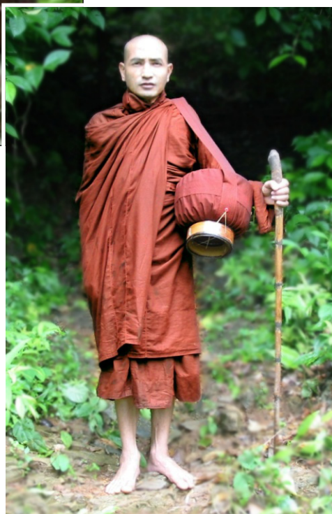
上图：偏袒右肩披着上衣