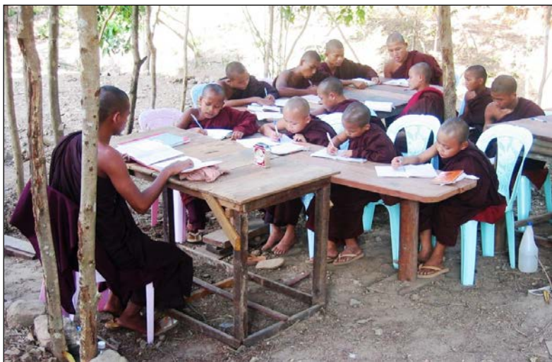
▲ 师长有教导弟子的义务